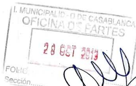
RICARDO PROVOSTE ACEVEDO Contralor Regional Valparaíso CONTRALORÍA GENERAL DE LA REPÚBLICA