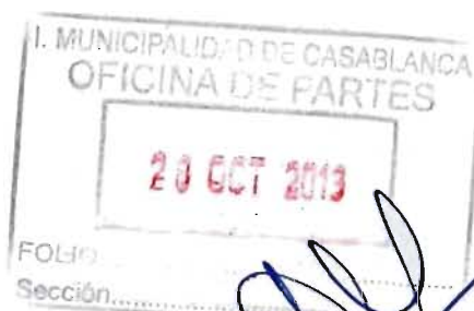
RICARDO PROVOSTE ACEVEDO Contralor Regional Valparaíso CONTRALORÍA GENERAL DE LA REPÚBLICA